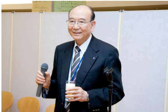
住吉義通・明治薬科大学理事長（乾杯）