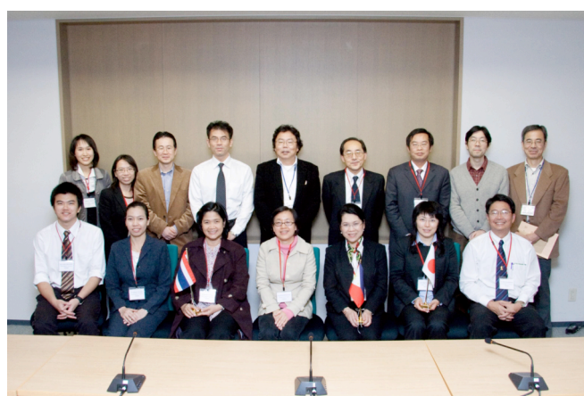
スピーカー (6名)、座長、及び組織委員による記念写真