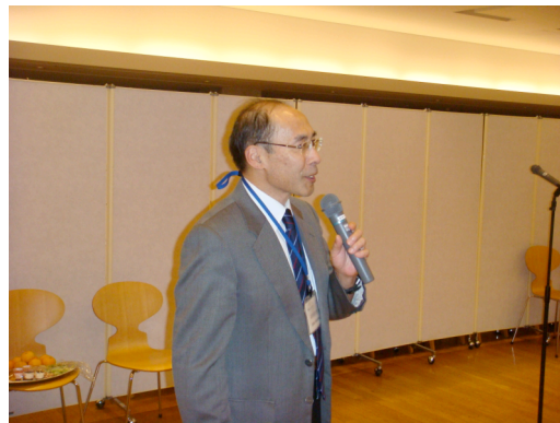
石井啓太郎・明治薬科大学副学長（挨拶）